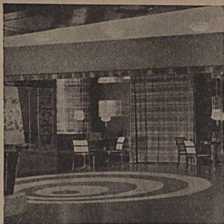
Linoleo D. L. W. num Hall.